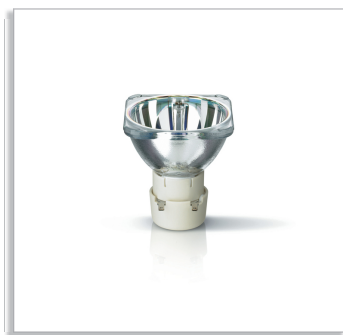
MSD Platinum 5 R